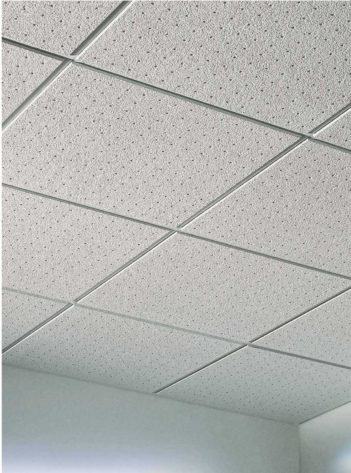
Contrast Circles Microlook