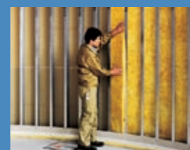
Montáž priečkovej plste URSA® TWF 1