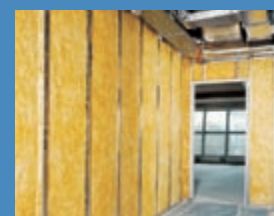
Izolácia URSA GLASSWOOL® v konštrukcii priečky