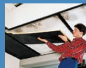
Montáž dosiek URSA® AKP 3/V-S do konštrukcie podhládu